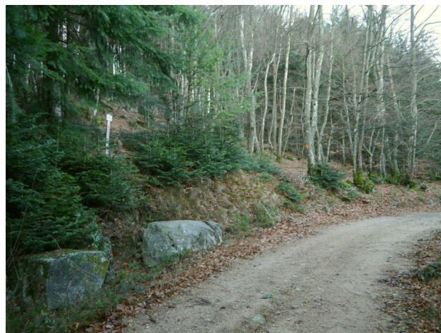
A la montée, en direction des Biefs