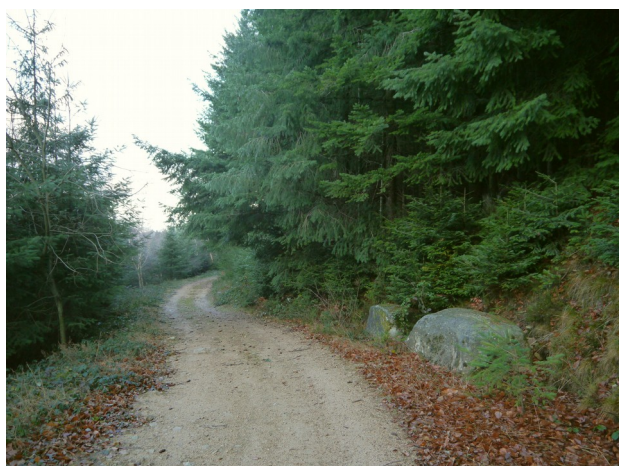
A la descente en direction du Bourg

Dans les temps anciens, du temps où l'on mourrait principalement chez soi, les défunts devaient donc être descendus au bourg de St Bonnet afin d'être inhumés dans le cimetière du village. Lorsque voitures et routes départementales n'existaient pas, ceci se faisait à dos d'hommes. Les porteurs empruntaient le chemin du téléphone, aujourd'hui bien connu des randonneurs. Ils remontaient jusqu'au col séparant le plateau des Biefs de la vallée du Vauzet puis entamaient la descente vers le Bourg. Le chemin était long et pénible. Ils avaient donc pris l'habitude de faire une halte en cours de route. Ils posaient le cercueil sur un rocher plat au bord du chemin et pouvaient se reposer un moment. Cette pierre est toujours visible et elle est connue des anciens du village sous le nom de: «la pierre des morts».